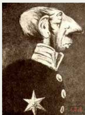
Пфейфер. Художник А. Юнгер. 1907