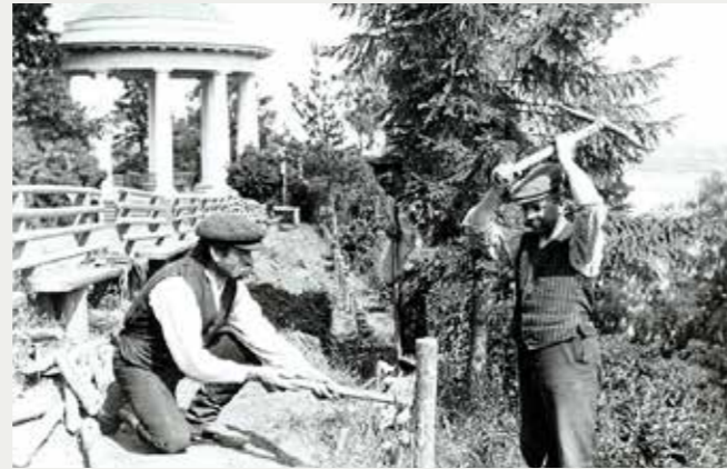
Вятские жители за работой