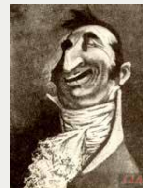
Маркиз де Санглот. Художник Н. Ремизов. 1907 г.

произошел. И мы вспоминаем еще одну книгу, которая была написана чуть раньше — роман очень тонкого и точного литературного критика Николая Гавриловича Чернышевского, который называется «Что делать?» Книга замечательна, особенно если знаешь, зачем ее читать. Это действительно роман об идеальном устройстве земного общества. И при этом роман, который никакого отношения к земному обществу не имеет. История «Что делать?» в действительности не была связана с реальными проблемами жизни, а с надмирными фантазиями. Сострадая Чернышевскому как человеку, по недоказанному обвинению угодившему в многолетнюю ссылку, Салтыков, создавая «Историю одного города», никак не мог согласиться с Чернышевским как с писателем, и его антиутопическая направленность, в том числе и против «Что делать?» — в «Истории...» присутствует. Но секрет и тайна литературы в том, что писатель пишет, имея в виду одно — а получается у него образ, охватывающий многое-многое другое. Исходя из конкретных посылов, по которым писалась «История одного города», Михаил Евграфович вывел универсальную книгу о вечном мироустройстве, о человеке, о роли власти в жизни. И поэтому она будет оставаться одной из центральных и главных книг в нашей реальности и литературном мире.