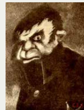
Угрюм-Бурчеев. Художник Н. Ремизов. 1907 г.

Так просто, как с метеоритом в объяснениях человеческой жизни не получается. Салтыков говорит о катаклизме человеческом, государственном, который все равно