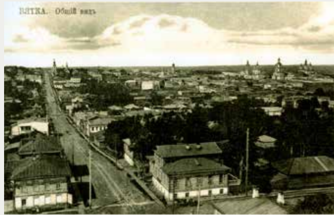
«Во глубине России»

быть столичными штучками, как Хлестаков... Кому же служить «во глубине России»?! Поэтому начальство строго следило за своими подчиненными: оступился, напечатал что-то без спросу, прочитал какие-то подзрительные сочинения — поезжай-ка, дорогой, в Вятку и хорошенько там послужи. Подобное ранее произошло с «солнцем нашей поэзии» — молодым Пушкиным, которого отравили чиновником в так называемую «южную ссылку». Ей мы обязаны многими шедеврами Пушкина, да и он сам — жил не тужил, изучал Божий мир, влюблялся и вновь влюблялся! Конечно, тогда в Крыму не было тусовки на Казантипе и санаториев ЦК КПСС, но тоже было неплохо — и там, и в Одессе... О своих «ссылках» (в том числе и в Вятку) тепло вспоминал и Александр Иванович Герцен, гений русской мемуаристики. Окончательно запутавшись в семейных и любовных отношениях, он вдруг стал писать книгу о судьбах русской революции. Блистательная книга, благодаря которой можно многое понять о русской истории.