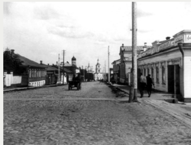
Вятка (ныне - город Киров)

Эта книга не только сатирическая, но и философская, и социально-политическая; книга, в которой очень много того, что впоследствии мы будем называть «Щедрин» — неповторимое сочетание сатиры и глубокого психологизма. Это произведение стало одним из первых в той «новой литературе», которая связана с реформами императора Александра II. Здесь надо подчеркнуть, что