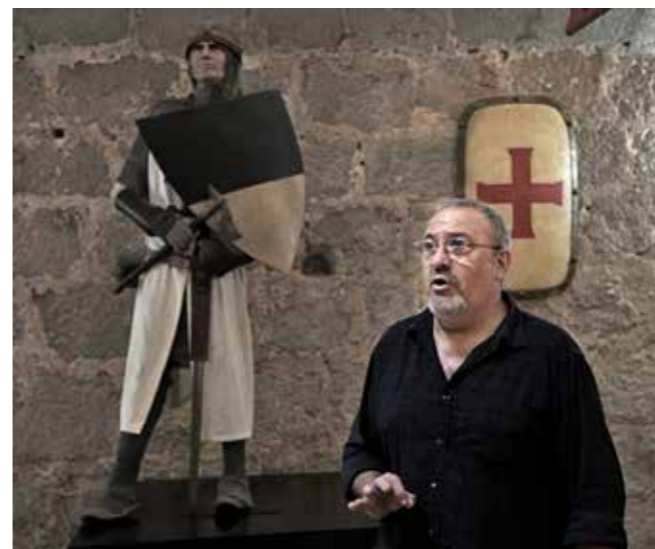
Джорди Пау. Гимн Тамплиеров

В качестве презента для музея в Кастельёне я сознательно привез пятитомник — «Челябинская область в фотографиях. История Южного Урала с 1900 до 2000 год». Но совершенно не ожидал встретить особенный интерес публики при знакомстве с этими альбомами. Испанцы буквально открывали для себя Россию, Южный Урал. Их удивил сам факт, что где-то в России — а отношение к нашей стране в Европе очень разное, полярное, особенно сейчас, — вдруг издают такие удивительные книги по истории родного края. Причем