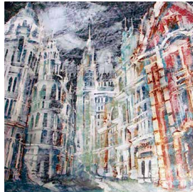
Гран Виа, Мадрид, 70x70, картон, силикон