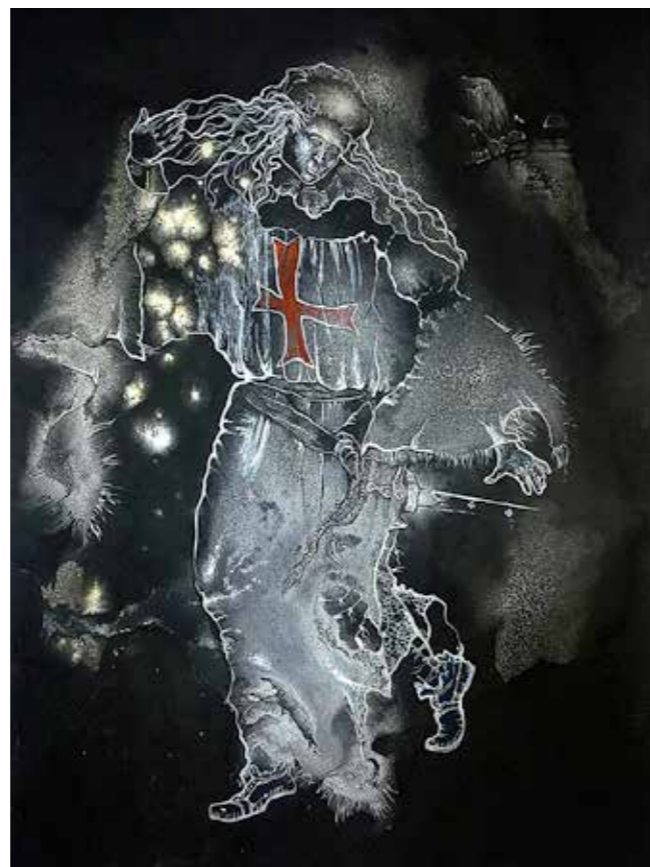
Дама Тамплиер, 70x80, картон, эмаль

Да, эта выставка будет «историческая», то есть рассказывающая о знаковых событиях в средневековой Испании. Она же познакомит нас с испанским опытом сохранения культурных традиций в организации массовых праздников, и, может быть, мы сможем взять его на вооружение. Та же Пенискола — это совсем небольшой город вроде нашего Миасса, причем эти города расположены в очень