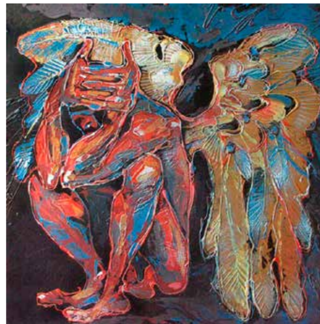
Ангел, 70x70, картон