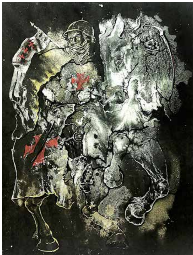
Тамплиер, 70x80, картон, эмаль

Наши музейные проекты ориентированы на массовую публику, на заинтересованное участие самых разных авторов, художников, фотографов... У нас есть богатый позитивный опыт в создании подобных «продуктов», которые могут быть интересны большому количеству людей, в том числе и на международном уровне. А «народные культурные проекты» с учетом массового спроса непременно «потянут» за собой и бизнес, и государственные отношения, и актуальную политику. Хочется в это верить... БК