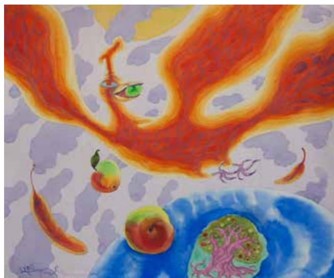
«Моя огненная птица»