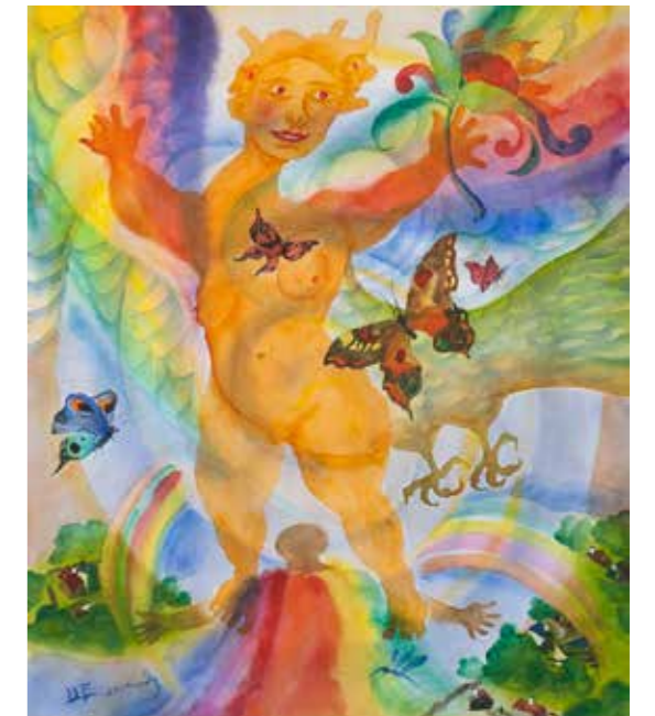
«Алконост» Алконост — птица радости. Она и птица, и в то же время женщина. Здесь все ярко по цвету: все связано с радугой. Это и сказка, и все что угодно, но пейзаж откровенно местный — я очень часто рисую именно уральскую природу.

Ведь воля и свобода — это разные вещи, поэтому естественно, что Пушкин говорил: «На свете счастья нет, но есть покой и воля...» Вот, опять его вспомнила! Ну куда деться от него! Я, может быть, не пришла бы к этому, но к Пушкину приходишь через другие слои. Он сам явился — и всё! БК