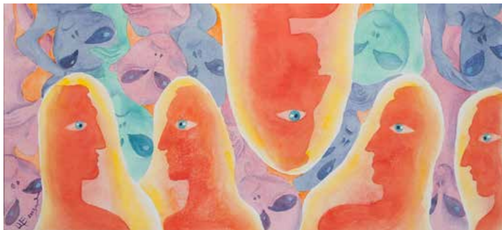
«По образу и подобию»