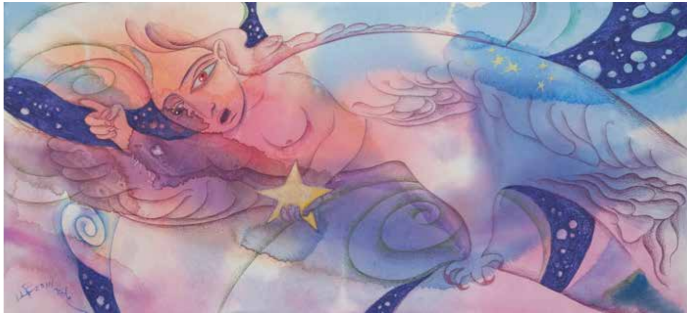
«Птица мудрости Гамаюн» Гамаюн — птица мудрости. И пятиконечная звезда — это древний символ Вселенной.