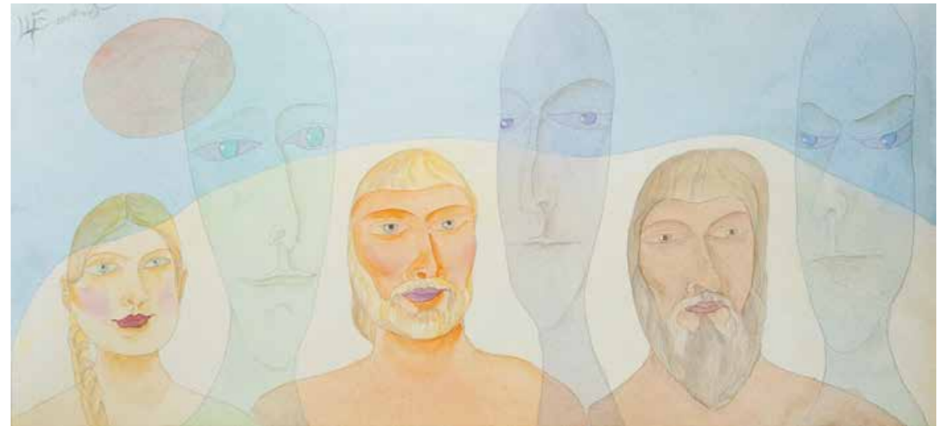
«Мы и они»

«И был создан человек по образу и подобию божьему». А что там за образ и подобие — уже каждому свое.