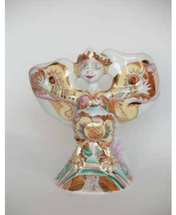
«Алконост — птица радости» Любимая птица-божество русского народа

Первые боги, посетившие Землю, — это летающие боги женского рода: птица печали Сирин, птица радости Алконост (это у меня всё есть в графике), птица мудрости Гамаюн, птица возрождения Феникс. Память народа, словно зеркало, отразила в веках их лики, оставила следы восхищения в предметах искусства.