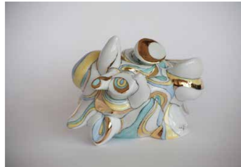
«Узел жизни» С ним связан любопытный момент. Директриса подходит и говорит: «Ничего не понимаю. А вот по цвету — да». А вообще его можно смотреть с любой стороны.

Я пыталась окунуться в глубины Руси не как в костюмированную декоративную даль, но как в энергетическое пространство, которое сильно отличается от нашего. И понять Русь, в которой было возможно всё: свободное перемещение на Земле и в космосе одной только силой мысли, путешествие во времени, общение с иными цивилизациями. Наш народ, ожидающий именно чуда, а не конца света, имеет истинно русские корни этого мечтателя и чудака.