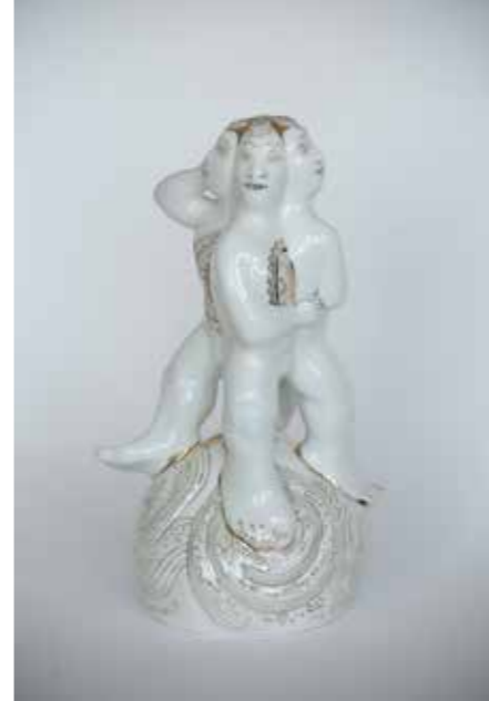
«На все четыре стороны»

Первым я сделала русского богатыря, и вот тот самый переплетающийся орнамент — чисто русский. А потом я сделала остальных богатырей, и хотя по цвету орнамент разный, но по сути одинаковый, как бы я ни старалась сделать его разным.