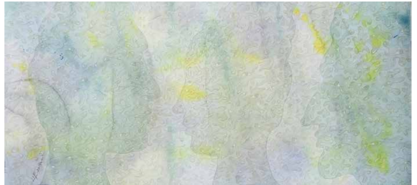
«Они и мы»

А то, что на слуху, — то на слуху. Но есть еще одна такая черта. Когда я изучала пантеон богов, то много литературы