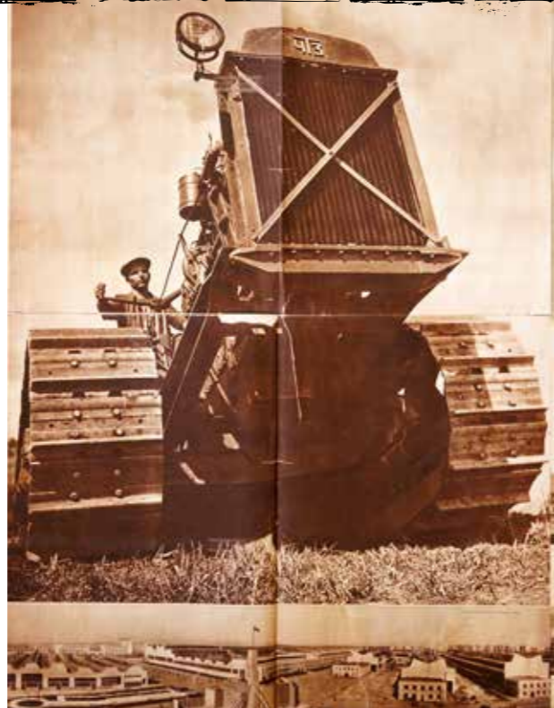
Плакат из журнала «СССР на стройке». ЧТЗ. 1933 г.

1. Нет смысла трогать политику как таковую — у нас ее нет по определению. Нет ни в стране, ни в регионе. Политика — это конкуренция. За голоса избирателей, за признание элит. А она предполагает регулярную смену лидеров, что не заложено в нынешней российской матри-