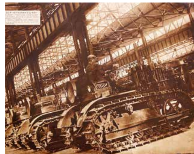
Иллюстрация из журнала «СССР на стройке». ЧТЗ. 1933 г.

А драма еще в том, что нам никуда не деться от глобальной конкуренции, которую мы очевидно проигрываем, как в свое время динозавры проиграли маленьким ящерам и земноводным. Поэтому мы просто вынуждены придерживаться тенденции на регионализацию, на глокализацию , как сочетание глобальных трендов и локальной идентичности, местной специфики, важной для мирового рынка. В геополитическом кризисе смогут выжить регионы, способные производить нечто уникальное в контексте экономики, культуры, интеллектуальной продукции.