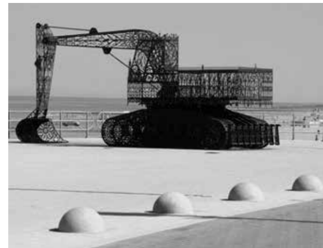
Вим Дельвуа. Серия «Caterpillar». Бельгия