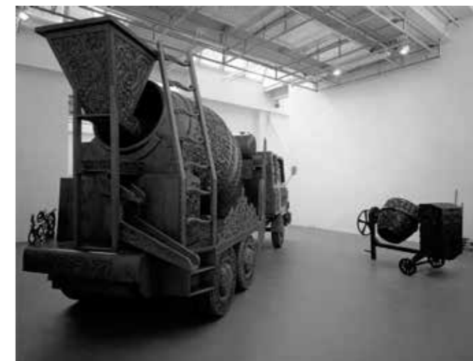
Вим Дельвуа. Серия «Caterpillar». Бельгия