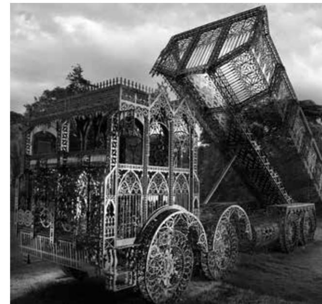
Вим Дельвуа. Серия «Caterpillar». Бельгия

Политехническая культура — это много больше, чем просто история крупных производств. Обдумывая желаемый образ будущего региона, никуда не деться от индустриальной истории. Да, сначала здесь были степи, потом построили крепость, провели железную дорогу... Нако-