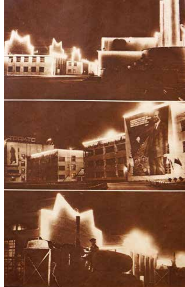
Иллюстрация из журнала «СССР на стройке». ЧТЗ. 1933 г.

В мире набирает популярность индустриальное искусство , пользующееся устойчивым спросом в определенных (развитых!) странах или регионах. У соседей-свердловчан готовится уже третья индустриальная биеннале современного искусства с зарубежными «звездами». Это чрезвычайно интересная и содержательная затея при энергичной поддержке администрации губернатора. И Челябинск мог бы провести серию фестивалей индустриального искусства, начиная от живописи и заканчивая industrial-роком — от Луиса Лозовика до Жерара Триньяка. Они стали бы событиями не менее резонансными, чем чемпионат мира по дзюдо, который, кстати, потряс воображение всех любителей и знатоков борьбы! И индустриальное искусство может быть особенно органично внутреннему содержанию и истории региона. У нас масса возможностей для подобных шоу: пустынные корпуса предприятий, огромные территории — один «Станкомаш» чего стоит! Или ЧТЗ, АМЗ... Можно проводить рок-концерты, выставки инсталляции, живописи... заявиться в мире как «евразийский центр индустриального искусства», что будет способствовать смене имиджа региона, а точнее — возврату его естественного образа, вытекающего из истории и самосознания живущих здесь людей, способных ощутить себя как уникальную, интеллектуально оформленную культурную общность.