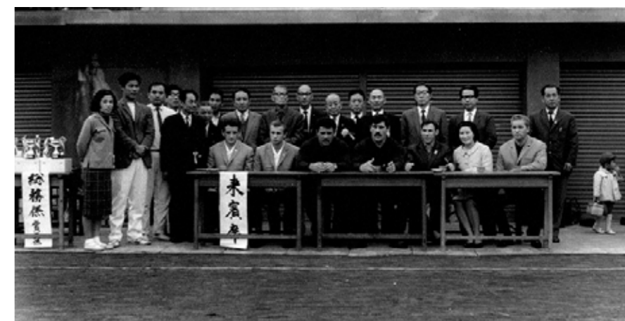
Фото на память с олимпийскими призерами. Токио-64