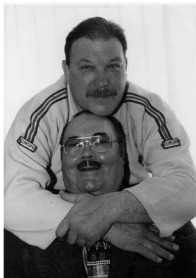
Тренер и ученик