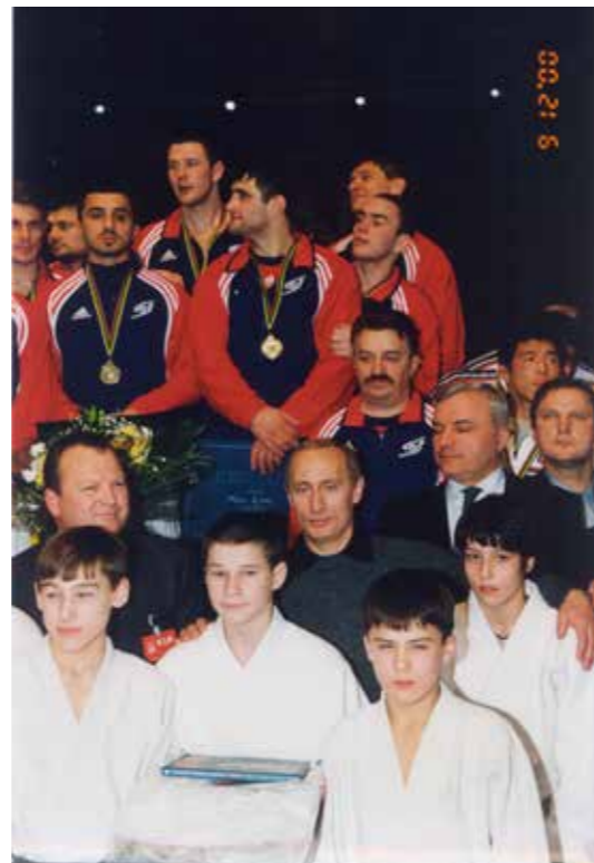
Встреча с президентом В. Путиным. Магнитогорск, декабрь, 2000