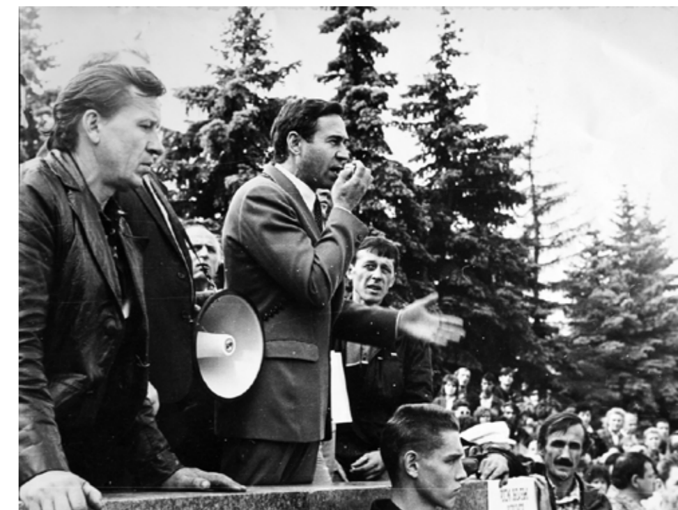
Митинг в поддержку президента России. Челябинск, площадь Революции, 19 августа 1991

10 ноября 1982 года умер Леонид Ильич Брежнев — это было как раз в День милиции. Похоронную комиссию возглавил Юрий Владимирович Андропов, который и заменил Брежнева на посту генерального секретаря ЦК КПСС. Андропов целых 15 лет возглавлял КГБ СССР, но незадолго до развязки в мае 1982 года стал секретарем ЦК КПСС по идеологии вместо легендарного Михаила Андреевича Сулова, умершего в январе 1982-го. Эту процедурную перестановку провели для того, чтобы сохранить видимость приверженности номенклатурному ритуалу.