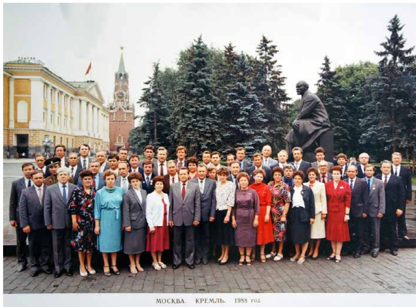
XIX партийная конференция. Москва, 1988