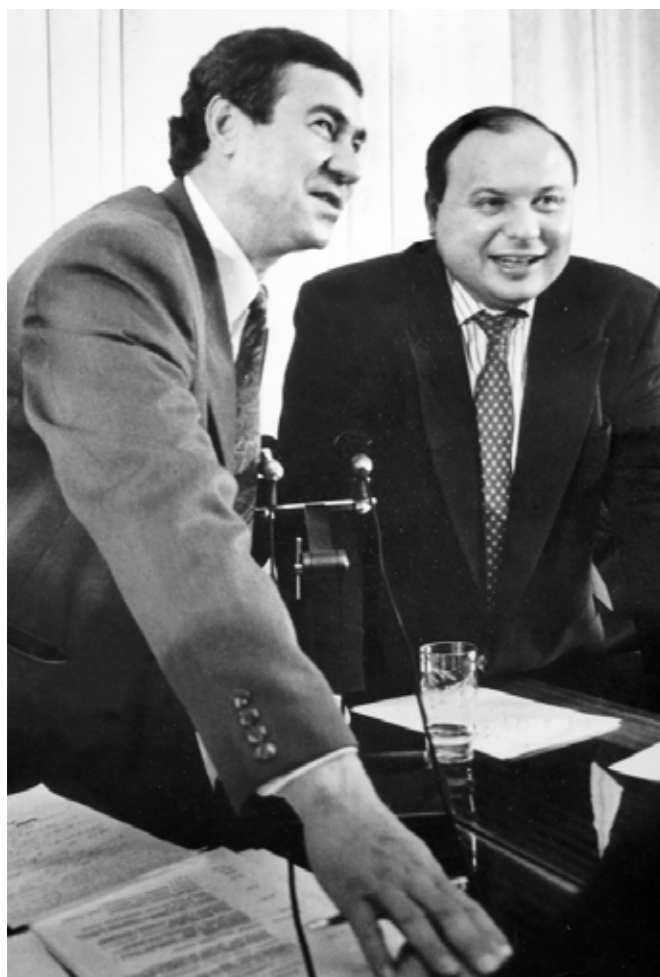
С Егором Гайдаром. Челябинск, 1992

В один из этих исторических дней мне довелось дежурить и принимать участие в написании некролога от ЦК ВЛКСМ на смерть генерального секретаря. Кстати, и в октябре 1980-го я также участвовал в подготовке некролога по поводу смерти Петра Мироновича Машерова, первого секретаря Компартии Белоруссии, погибшего в очень странной автомобильной катастрофе.