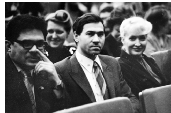
Дворец съездов. Москва, 1983

В период Карибского кризиса у нас было 300 единиц ядерного оружия, а у США — 3000. Но уже к семидесятым годам между нами практически сложился паритет на уровне 30 тысяч единиц у каждой из сторон. На