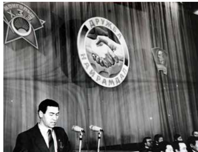
На высокой трибуне. Улан-Батор, 1982

Большая часть населения принимала все должным образом: «Как хорошо в стране советской жить!..» Правда, «строители коммунизма» не имели даже ми-