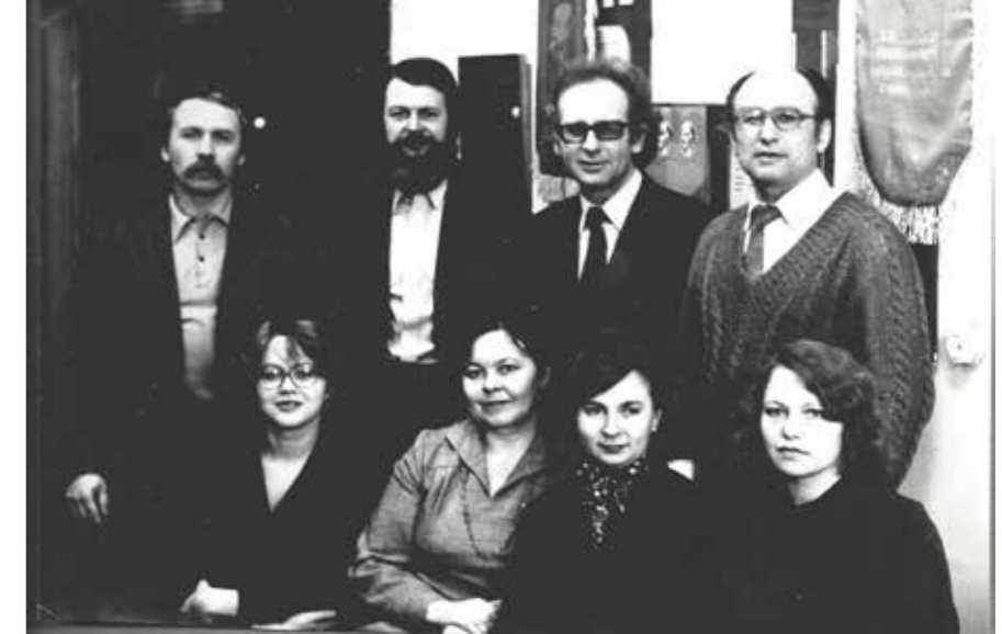
Кафедра научного коммунизма, ЧГПИ, 1980-е годы

Роман Юлиана Семенова «ТАСС уполномочен заявить...» и замечательный фильм, поставленный по нему режиссером Владимиром Фокиным, наглядно показывают противостояние не только советской