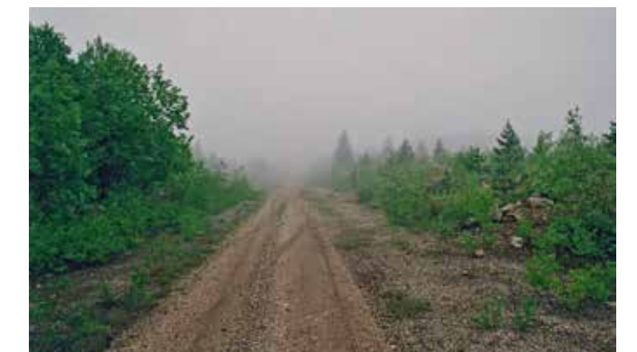
Туманное утро. Иркутскан