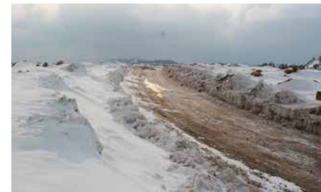
Бакал. На вершине Шихана