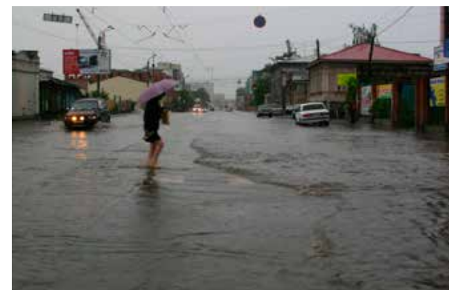
Челябинск, улица Труда

Еще один памятный случай. В день 80-летия Великой Октябрьской социалистической революции, 7 ноября 1997 года, целые сутки шел снег. И мы капитально застряли в дороге на всю ночь. Образовалась пробка длиной в 20 км на вершине Уреньги — ни туда, ни обратно. При двурядном движении машины стояли в шесть рядов! Ночью подорожало пиво (правда, когда бутылки стали раз-