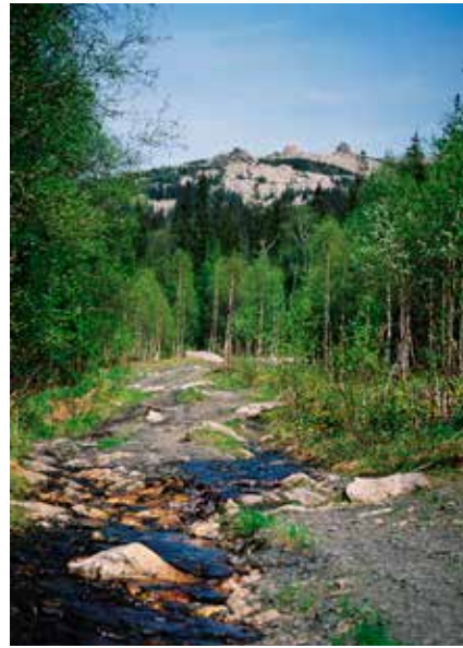
Дорога к скалам на Нургуше