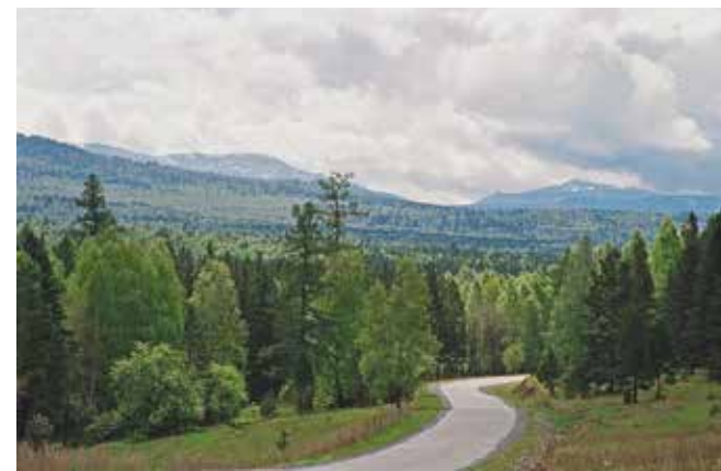
Старый Сибирский тракт, по которому ссыльные в кандалах шли в Сибирь

Когда я еду в дальние поездки на автомобиле — например, в Оренбург (7–8 часов), в Казань (12 часов), в Уфу (6 часов), в Тюмень, Шадринск... — то обычно беседую с водителем о житье-бытье или слушаю музыку. Раньше много слушал в машине аудиокниги, в основном школьную программу по литературе. И иногда под настроение могу в ожидании самолета или прямо в самолете что-то печатать. Вот так практически напечатал целую книгу своих воспоминаний.