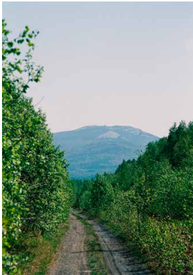
Дорога на оз. Зюраткуль