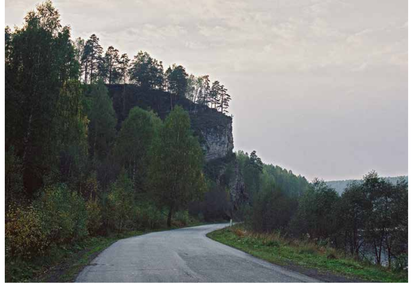
Вдоль реки Ай