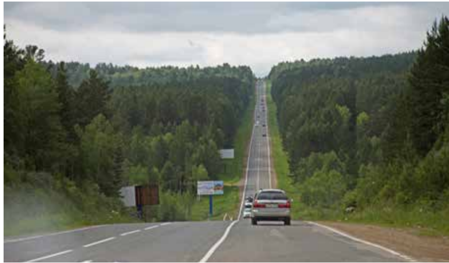
Дорога для Л. И. Брежнева на оз. Байкал (Иркутск-Листвянка)