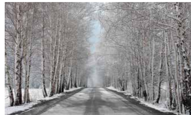
Дорога на оз. Зюраткуль. Февраль