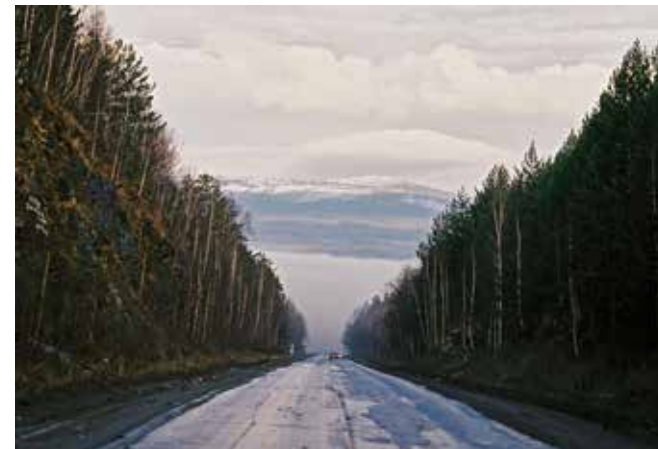
Трасса М-5. Спуск к Уреньге