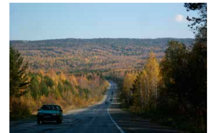
Спуск с Уреньги