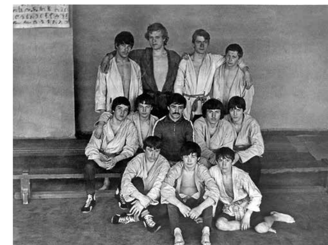
Секция дзюдо СГПТУ-101