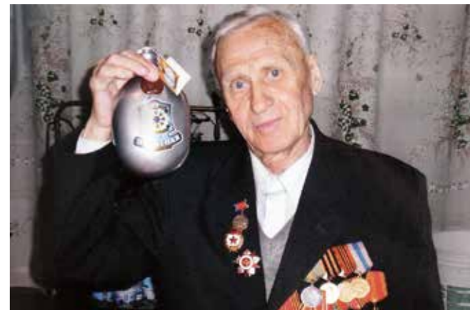
За Победу! 9 мая 2005 года

И увлечься можно чем угодно даже после того, как оставишь свою работу... Я ушел на пенсию в 86 лет, последнее время болею, мотор начал сдавать... БК