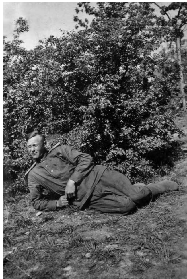
Винер-Нойштадт, Австрия. Май, 1946 г.