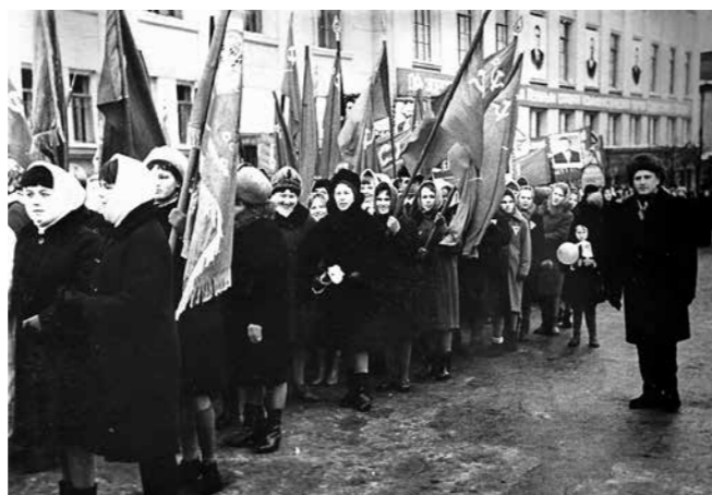
Слава Великому Октябрю!