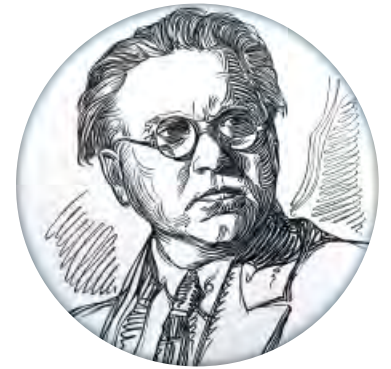
→ Федор Гладков ←