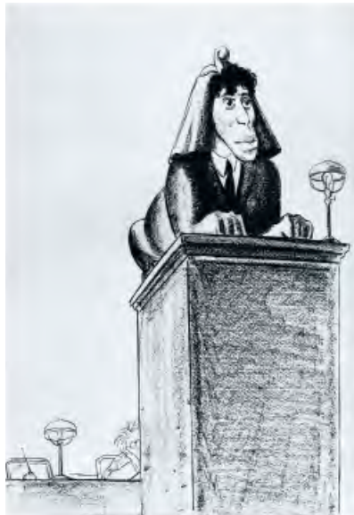
Пастернак. Шарж Кукуриников

«Большой скачок» в промышленности привел к голоду. Проезжая по стране, писатели не могли этого не видеть. В книге о Пастернаке, вышедшей в серии «ЖЗЛ», Д. Л. Быков приводит слова, сказанные Пастернаком Варламу Шаламову: «Я... был поражен поездкой — вдоль вагонов бродили нищие в домотканой южной одежде, просили хлеба. На путях стояли бесконечные